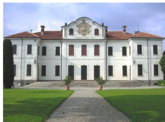
Banda Santa Cecilia Montesolaro Diretta dal maestro Matteo Monti Sabato 13 luglio 2024 ore 21 Villa Calvi Montesolaroalto