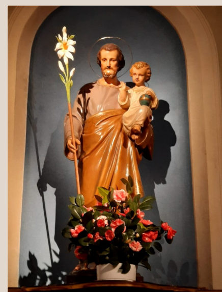
• STATUA S. GIUSEPPE CHIESA SAN MICHELE •

Salve, custode del Redentore, e sposo della Vergine Maria. A te Dio affidò il suo Figlio; in te Maria ripose la sua fiducia; con te Cristo diventò uomo.