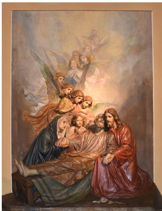
• ALTARE S. GIUSEPPE CHIESA SS. DONATO E CARPOFORO •